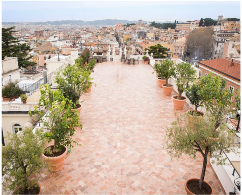
Palazzo Volpi Gallopi, Rome