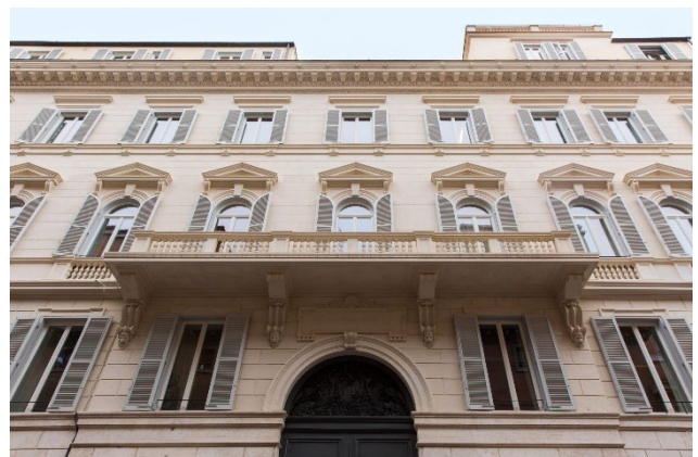
Palazzo Volpi Gallopi, Rome.

L'actif est loué à l'IVASS (Istituto per la Vigilanza sulle Assicurazioni), autorité publique de tout premier plan. Cette acquisition s'inscrit dans une stratégie de détention à long terme, visant à bénéficier de la dynamique favorable du marché immobilier romain : faible vacance dans le quartier central des affaires, hausse des loyers prime et renforcement de l'attractivité de Rome auprès des investisseurs institutionnels internationaux.